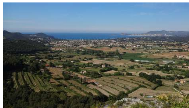
vue de la baie de Saint-Cyr-La Ciotat