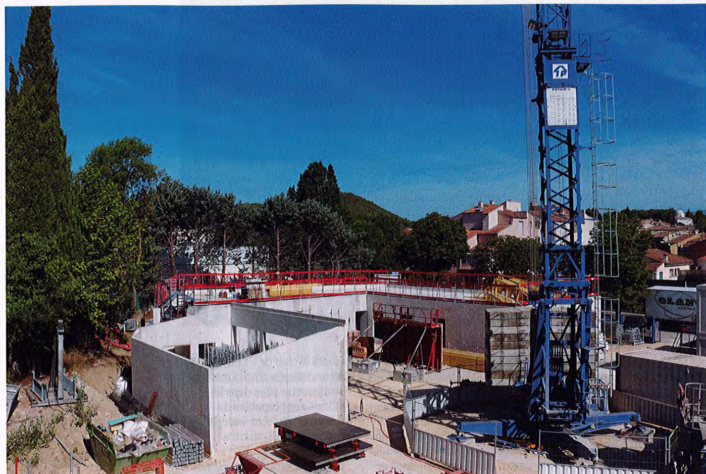
Au second plan se trouve la future caserne, au premier plan les garages attenants.

L'activité est dense sur le chantier de la future gendarmerie du Beausset. Composé d'une caserne et de logements, deux parties bien distinctes, l'ensemble sera livré, comme prévu, à l'été 2024.