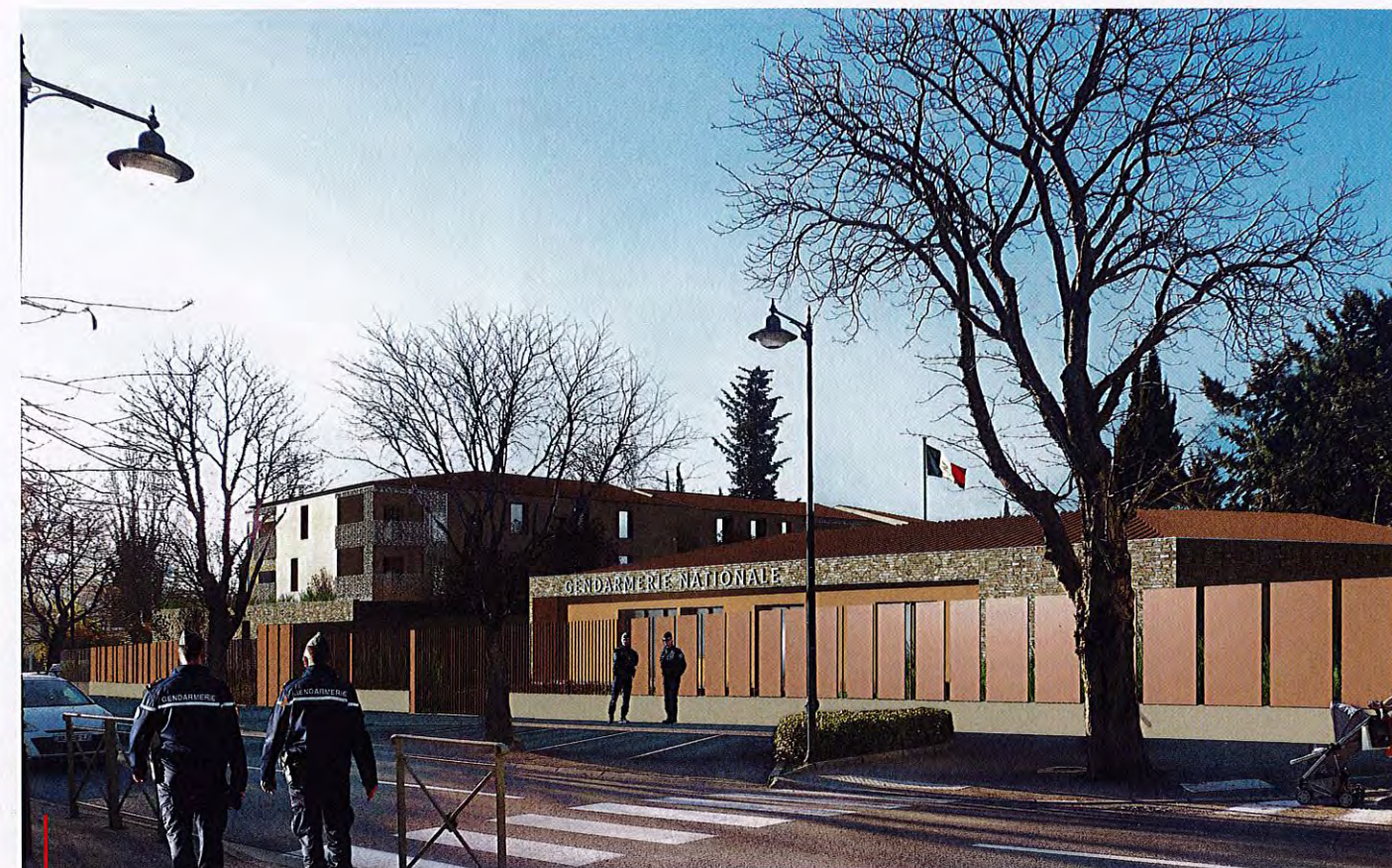
La future gendarmerie du Beausset.

Le coup d'envoi des travaux de cette nouvelle gendarmerie a officiellement été donné en octobre 2022, avec la démolition et le désamiantage des anciens logements. À noter que ces logements étaient quasiment tous inoccupés depuis 2016 du fait de leur vétusté. L'ancienne caserne, dans un état général à peine meilleur, sera démolie et désamiantée à la fin des travaux soit en juin 2024. Cette opération sera suivie